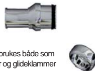
Klammeret brukes både som fastklammer og glideklammer