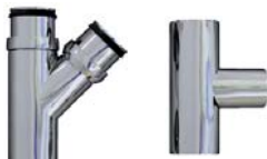
45° grenrør har to nipler / 90° har kun spissender